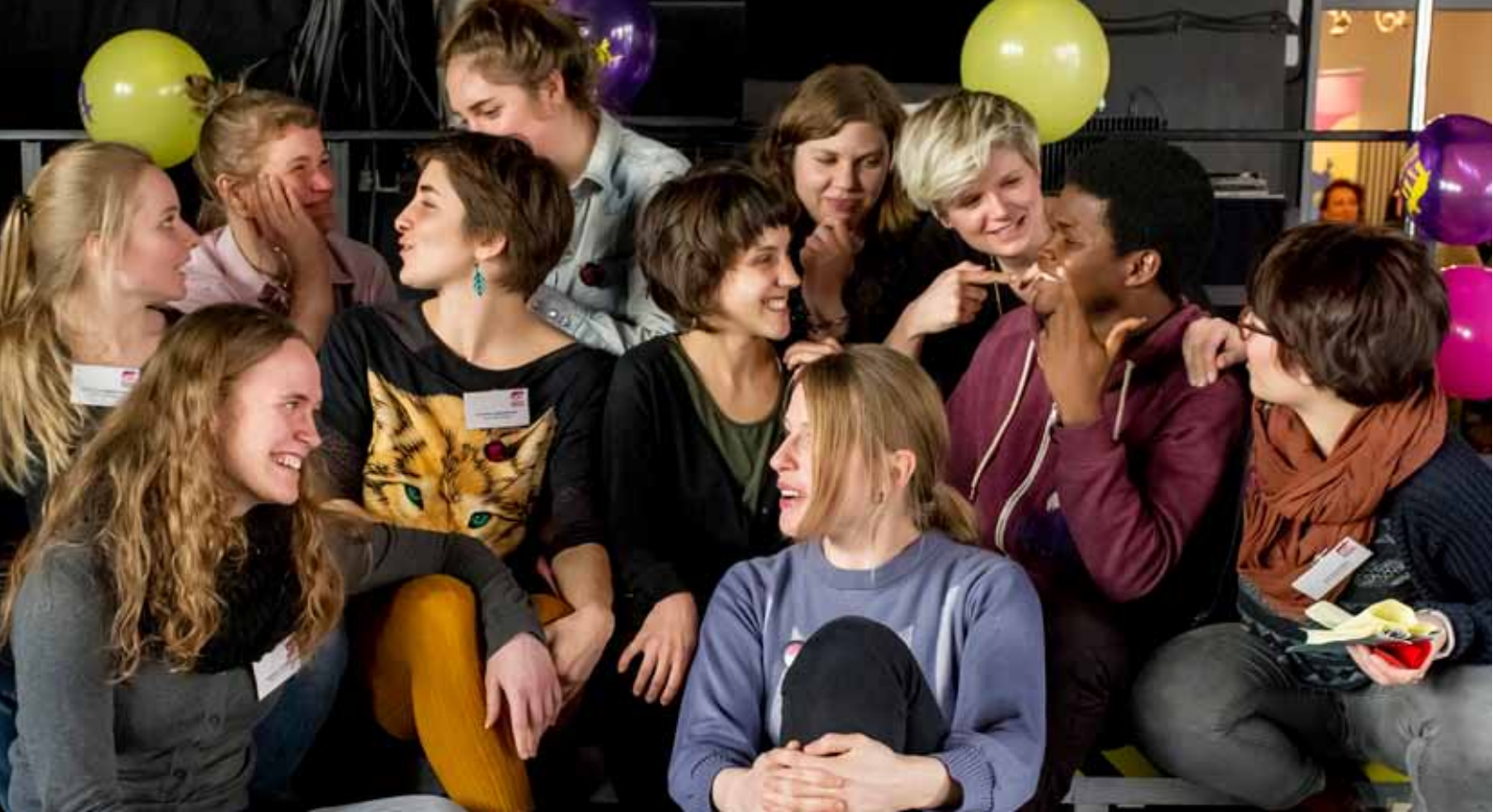
Teilnehmer*innen des next generation workspace 2016/2017