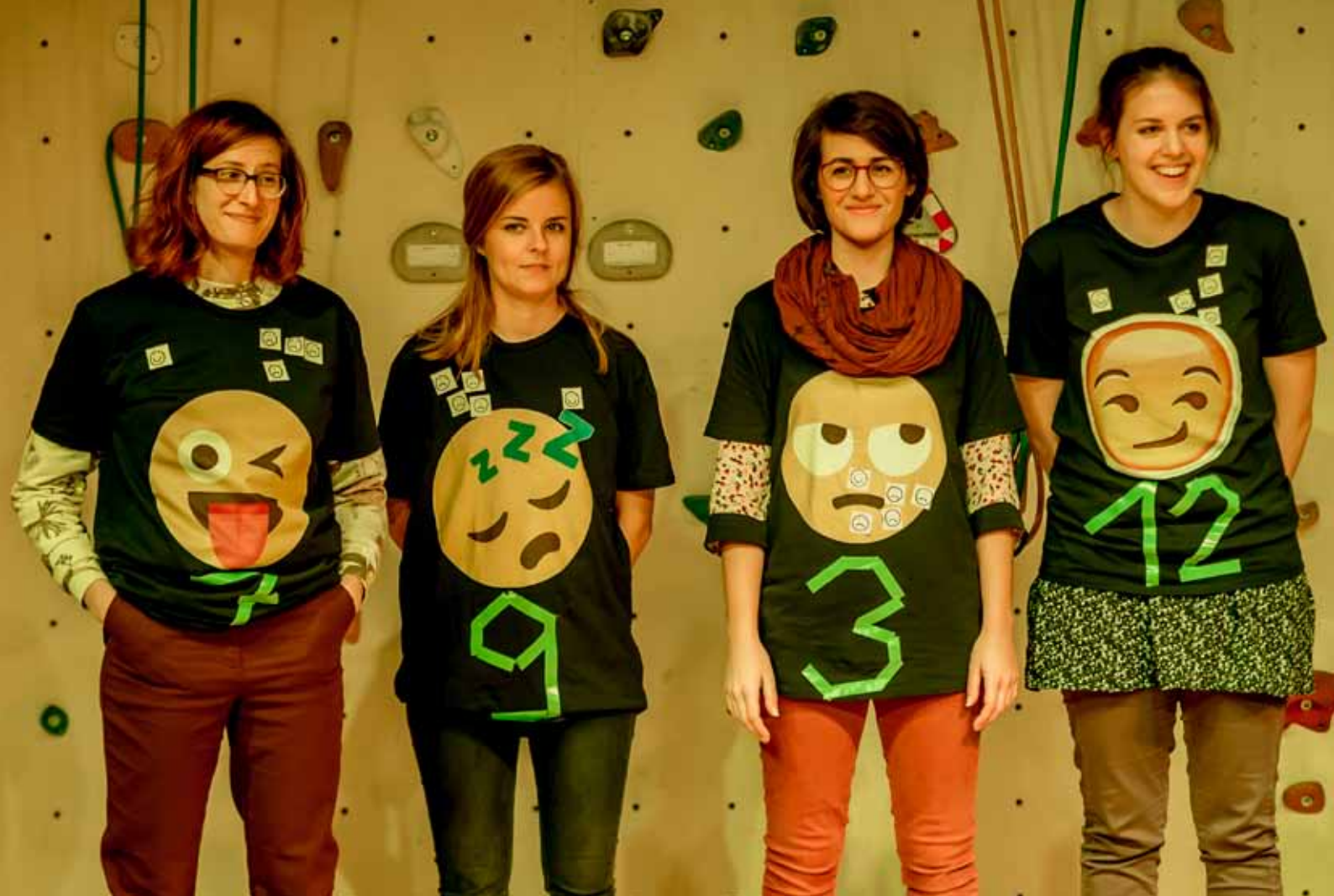
The Club of Emoticons

erhaus Frankfurt. Eine Realisierung des Konzepts „ROOMS“ von HELLA LUX (Milena Wichert und Liljan Halfen) ist für 2018 im Mousonturm geplant, das Theaterhaus G7 in Mannheim (Leitung Bernd Mand) wird Gastspielstätte. Weitere, auch internationale Kooperationspläne sind bereits angedacht. Um eine Teilnehmerin des NGW Finales 2017 zu zitieren: „Ihr werdet noch von uns hören!“.