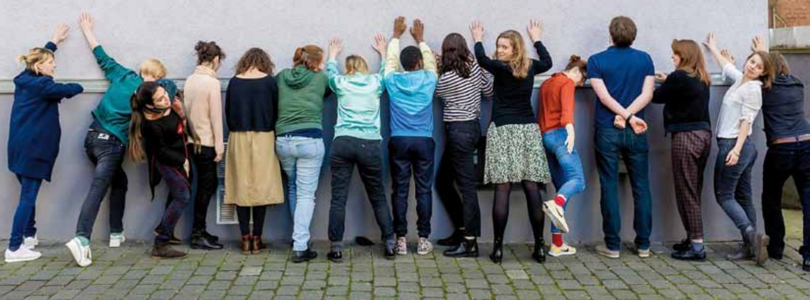
Teilnehmer*innen des next generation workspace 2017/2018